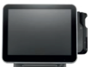
Lector MSR, SCR