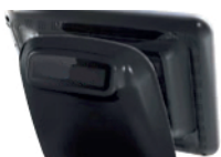
Pantalla de cliente VFD