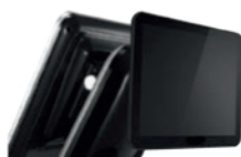
Segunda pantalla LCD